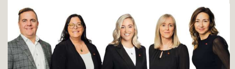
Groupe Lavoie Racette Financière Banque Nationale Gestion de patrimoine

N'hésitez pas à venir discuter avec nous si vous pensez réagir différemment aux aléas du marché. Nous nous assurerons que vos investissements demeurent en phase avec votre tolérance au risque.